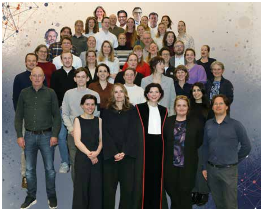
Een deel van het nucleaire geneeskunde team in het Radboudumc.

De afdeling Beeldvorming heeft een grote klinische productie (voorbeeld productiecijfers 2025: 4500 PET/CT scans, 2000 gammacamera scans en 230 therapieën) en heeft daardoor een belangrijke rol in het academische klinische domein van het Radboudumc. De klinische zorg maakt gebruik van de geavanceerde GMP faciliteiten van het hotlab. De zorg focust vooral op oncologie, infectieziekten, endocrinologie en theranostiek. De introductie van radioligandtherapie opent de weg naar gepersonaliseerde geneeskunde. Door een en dezelfde target voor diagnostiek en therapie te gebruiken is theranostiek een feit. Het Radboud Translational Medicine (RTM) heeft twee cyclotrons en zet zich in voor de ontwikkeling van radiofarmaca voor gebruik in de dagelijkse medische routine en in het biomedische onderzoek. Deze infrastructuur maakt het mogelijk om zowel klinische diagnostiek als hoogwaardig translationeel onderzoek uit te voeren. Preklinisch onderzoek is sterk vertegenwoordigd middels Preclinical Imaging Centrum (PRIME). PRIME levert geavanceerde